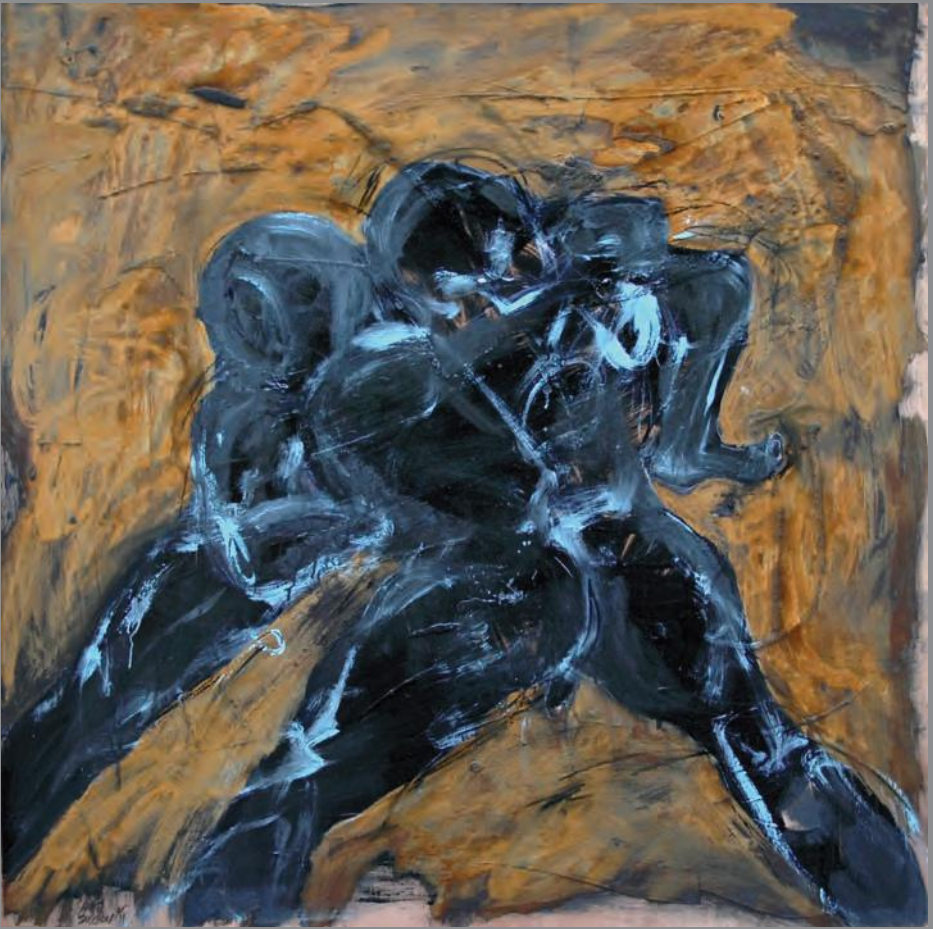
Sin título 2011. Técnica Mixta 120 x 120