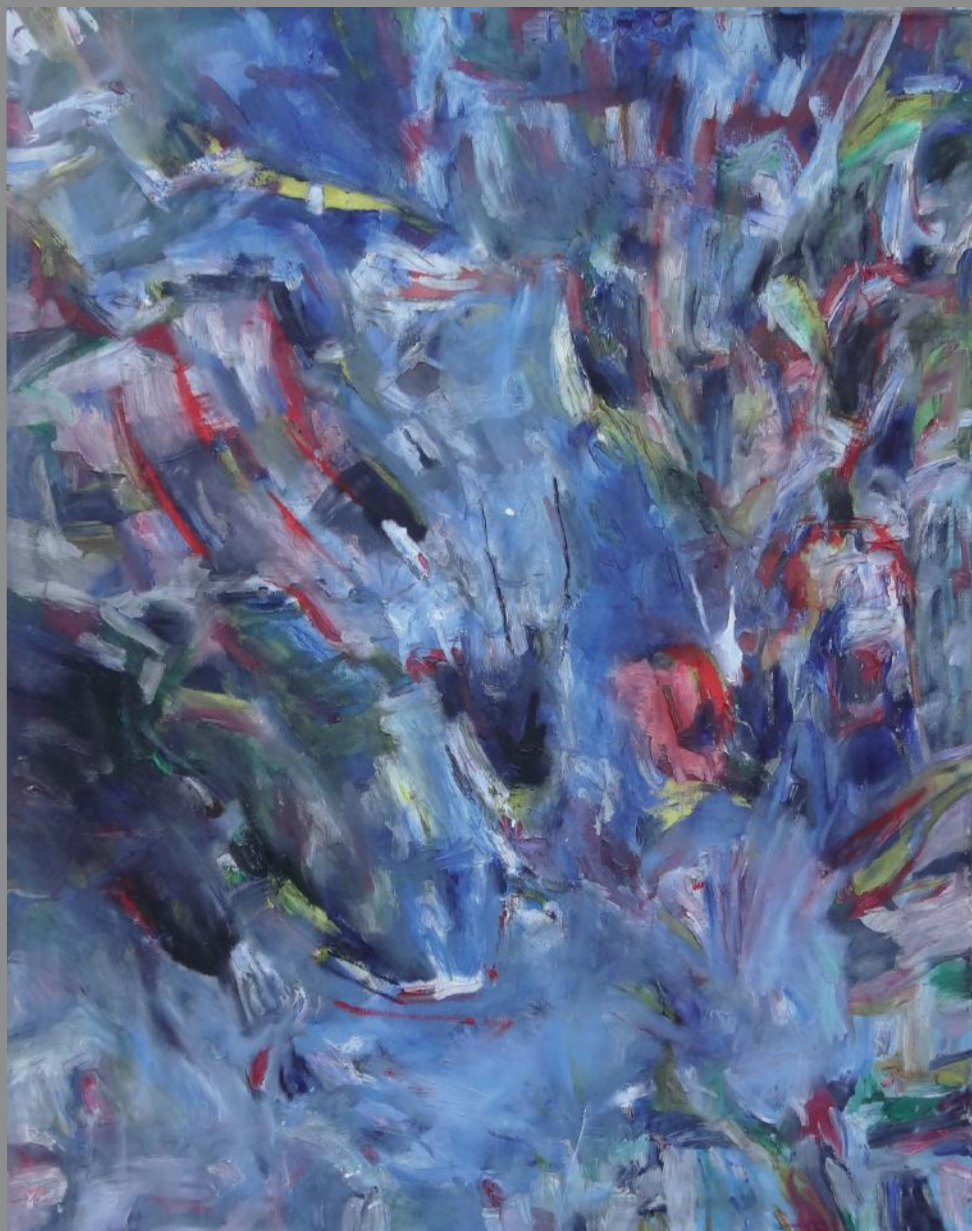
Sin título 2011. Óleo sobre lienzo 162 x 130