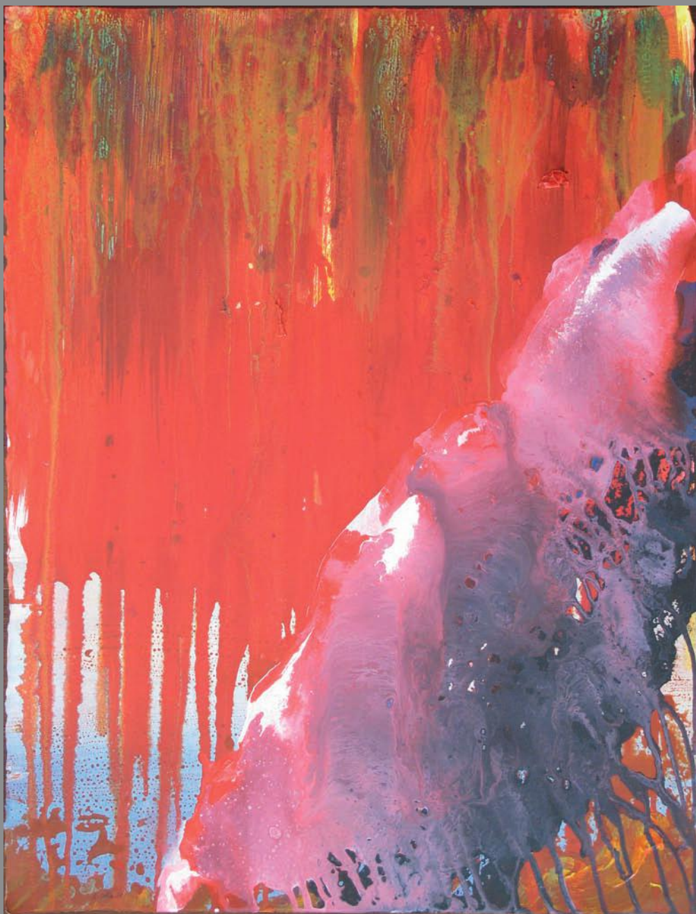
Lycenia 2010. Óleo y acrílico sobre papel 70 x 60