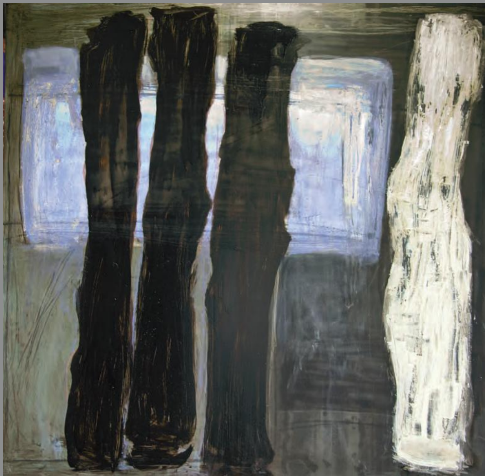
Disidentes 2011. Técnica Mixta sobre hierro. 100 x 100