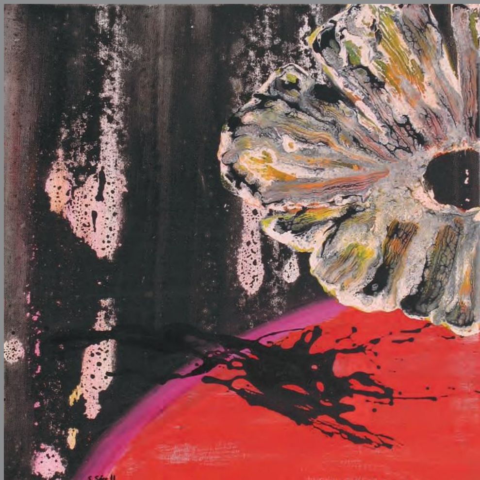
Cloe 2010. Óleo y acrílico sobre lino 50 x 50