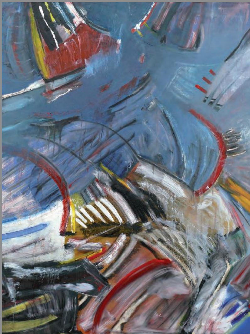
Sin título 2011. Óleo sobre lienzo 130 x 97