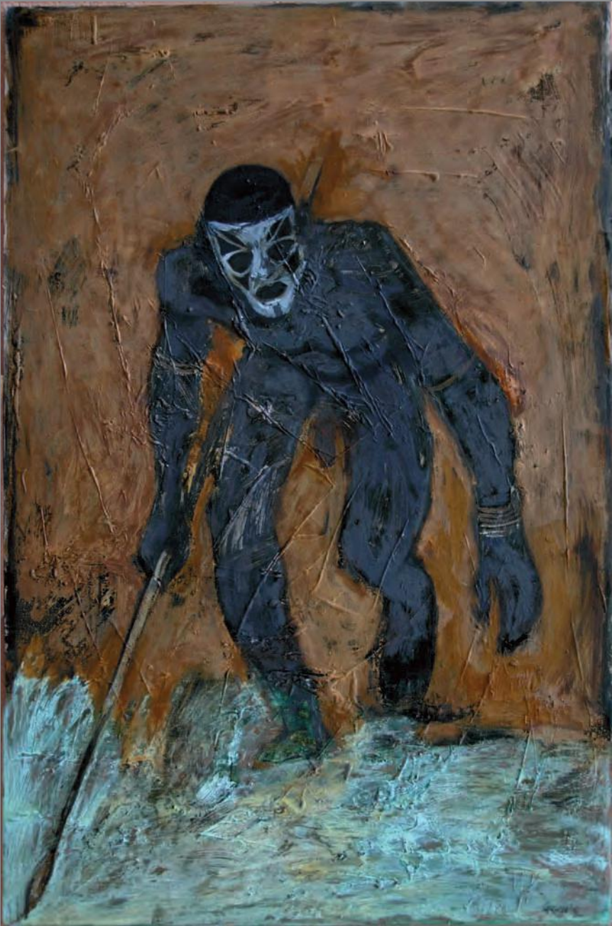
Sin título 2011. Técnica Mixta 168 x 120