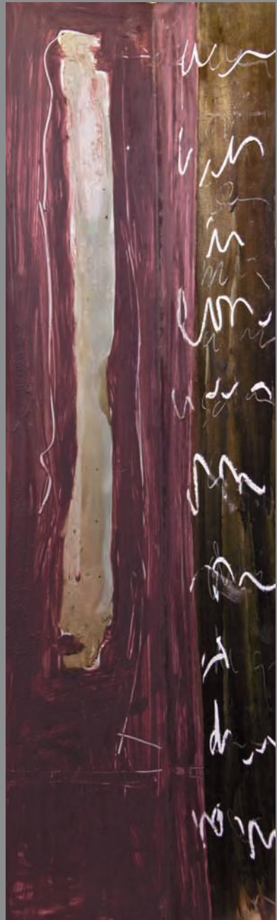
Sin título 2011. Dos esculturas. Técnica Mixta sobre hierro 70 x 14 x 22