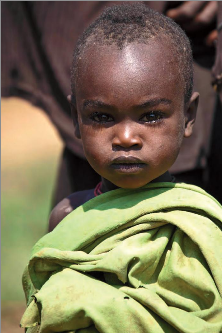
Ethiopia. Niño Hamer 2011. Tintas pigmentadas sobre papel baritado 110 x 80