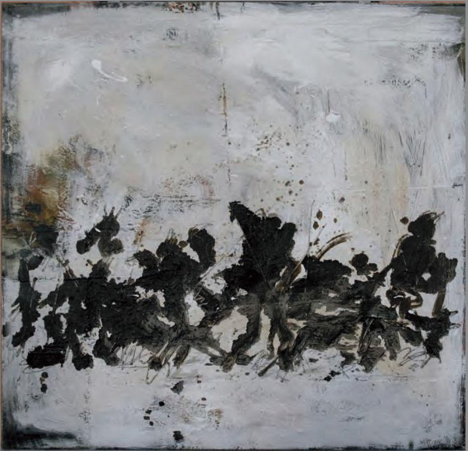
Sin título 2011. Técnica Mixta 120 x 120