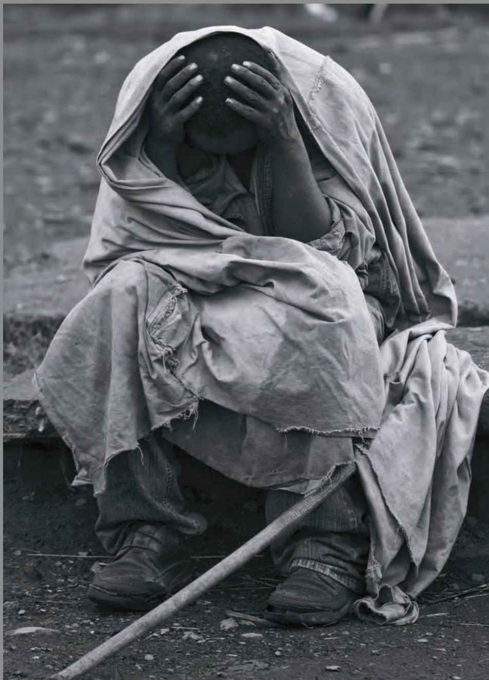
Ethiopia. Ocaso en Hawasa 2010. Tintas pigmentadas sobre papel baritado 110 x 80