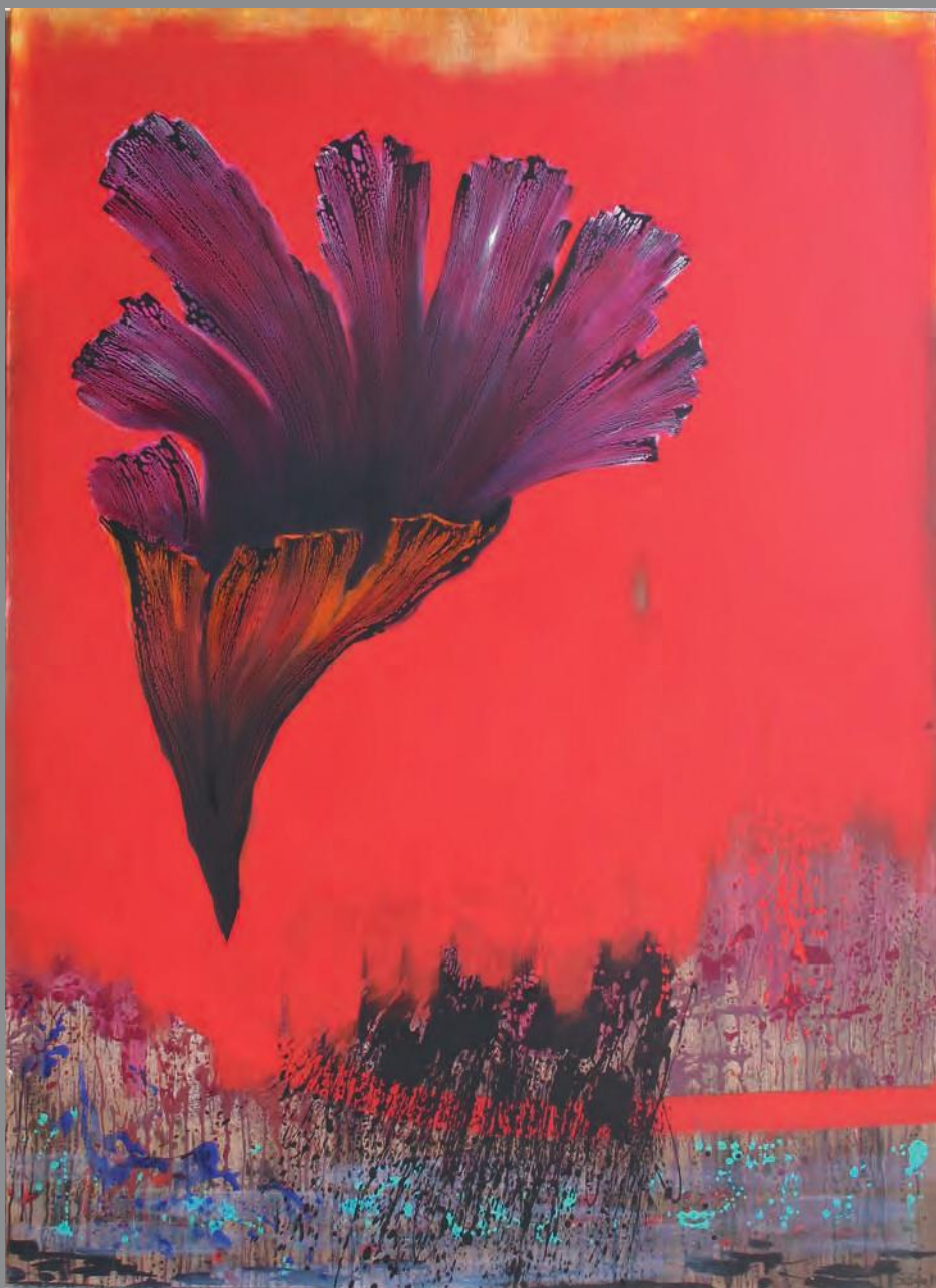
Dafne 2010. Óleo y acrílico sobre lino 195 x 150