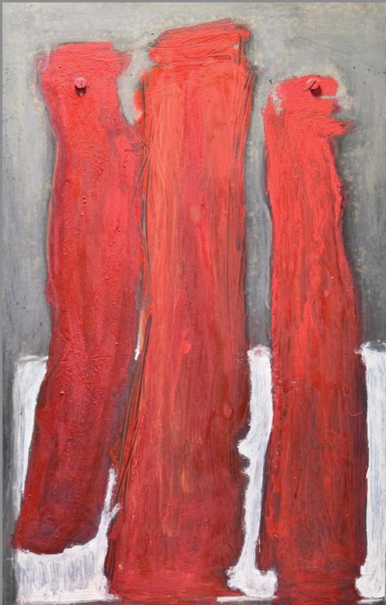
Tres figuras en rojo 2011. Técnica Mixta sobre hierro 45 x 27